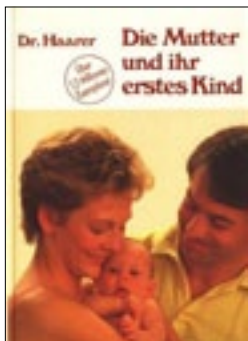
Auflagen von 1934–87