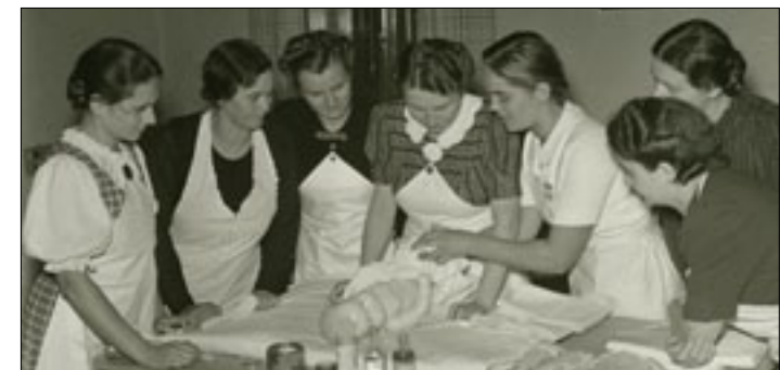
Im NS und danach: Ausbildung von Kinderpflegerinnen nach Haarer